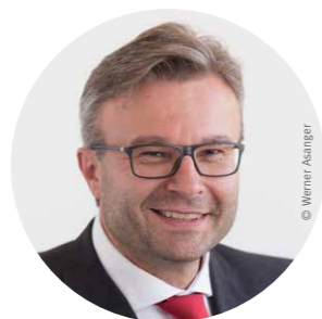
Dir. Mag. Thomas Märzinger Rotes Kreuz, Landesverband OÖ